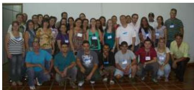
Participantes do treinamento de Atendimento

Empresas que participaram do treinamento: Botinas Nobuk; Chalana Confeccões; Casa do Guardanapo; Colombo Auto Peças; Depósito Gazola 2; D'Luma Confeccões; Escola Sabidinho Supremus; Estação Malhas – Malwee; Farmácia do Povo; Lonil Móveis; Mini Stop; Móveis Tem Tem; Phytomédica; Renata Modas; Supermercado Gazola e Zamy Design.