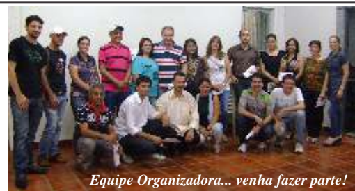
Equipe Organizadora... venha fazer parte!

Com a união das empresas que trabalham com eventos como: Buffet, Decoração, Bandas, Som, Palcos, Iluminação, Cantores, Convites entre outros, acontecerá nos dias 13 e 14 de julho no Salão Paroquial de Nova Esperança, a 1ª Feira de Eventos. A ACINE através do Conselho do Jovem Empresário está apoiando e dando suporte a realização deste evento, que conta com a organização de membros do setor. Se tiver interesse em participar deste evento, nos procure (44) 3252-5423.