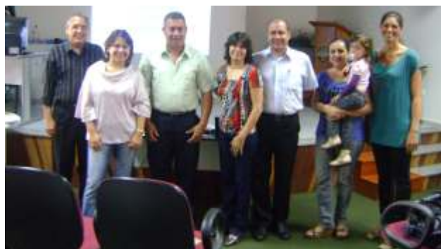
Participantes da Consultoria em Finanças - Projeto ALI