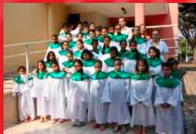
GRUPO MUSICAL DA ESCOLA MUNICIPAL JULIO BENATTI