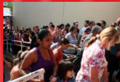
CONSUMIDORES DE NOVA ESPERANÇA E TODA REGIÃO CHEGARAM CEDO