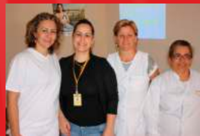
SECRETARIA MUNICIPAL DA SAÚDE ESTIVERAM PRESENTES NA FEIRA COM SERVIÇOS À POPULAÇÃO