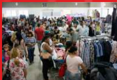
EM POUCOS MINUTOS OS STANDS FICARAM LOTADOS E PERMANECERAM ASSIM DURANTE OS DOIS DIAS DE FEIRA