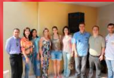
CONSELHO DA MULHER, DO JOVEM E ADMINISTRATIVO DA ACINE