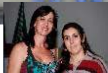
Recebendo das mãos da Presidente do ACINE Mulher a premiação

2º Colocado - 01 (um) jantar no Bistrô Goumert em Nova Esperança, com direito a um 01 (um) acompanhante, sendo que: