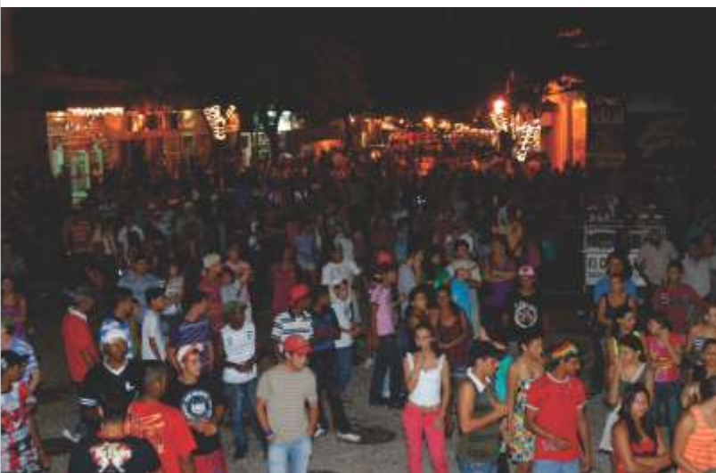
População compareceu em massa para curtir o show e a expectativa de ganhar os prêmios da Campanha de Natal Premiado