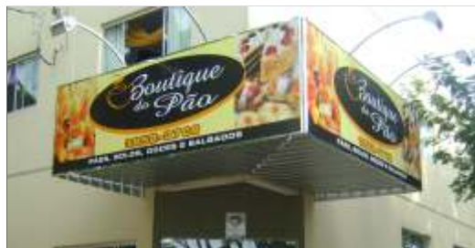
Boutique do Pão