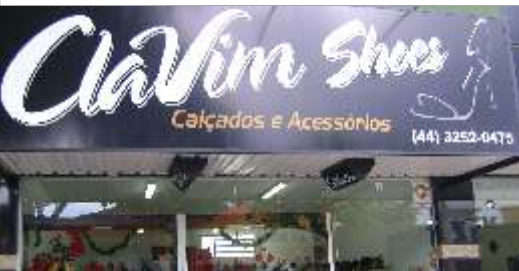
Clavim Shoes Calçados e Acessórios