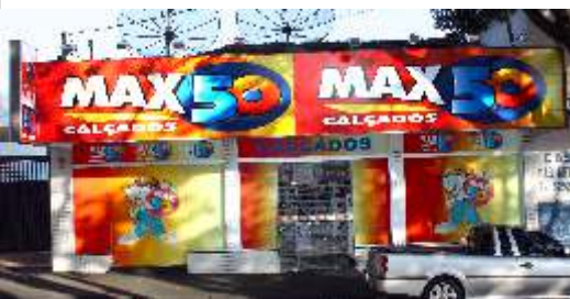
MAX 50 Calçados