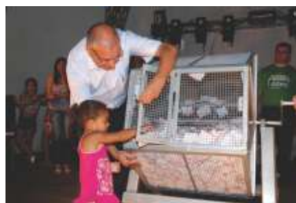
Transparência e ética, são regras para o sorteio da campanha de Natal Premiado.