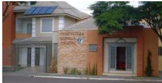
Construtora Gazolla Pasquini