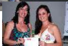
Recebendo das mãos da Presidente do ACINE Mulher a premiação

1º Colocado - 01 (uma) estadia no Hotel Fazenda em Campo Belo, com direito a um 01 (um) acompanhante, sendo que: