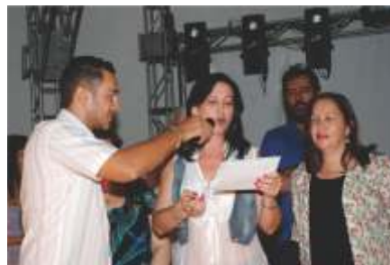
Concurso de Vitrines fez a diferença na decoração de Natal em Nova Esperança | ACINE MULHER |