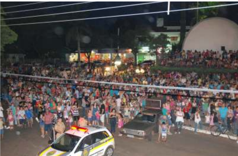
Uma multidão veio ver de perto a chegada Radical de Rapel do Papai Noel

PRÊMIOS, PROMOÇÕES E ALEGRIA DO NATAL EM NOVA ESPERANÇA!