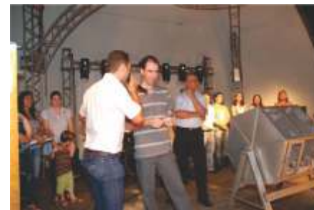
Na hora de divulgar o ganhador do gol zero km a emoção toma conta do público