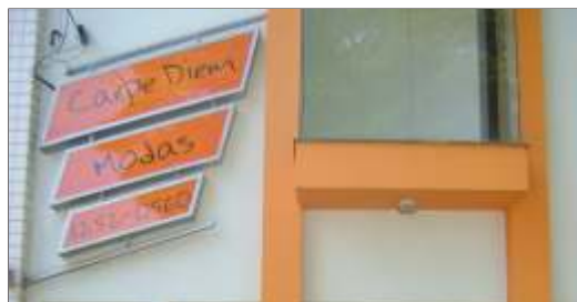
Carpe Diem Modas