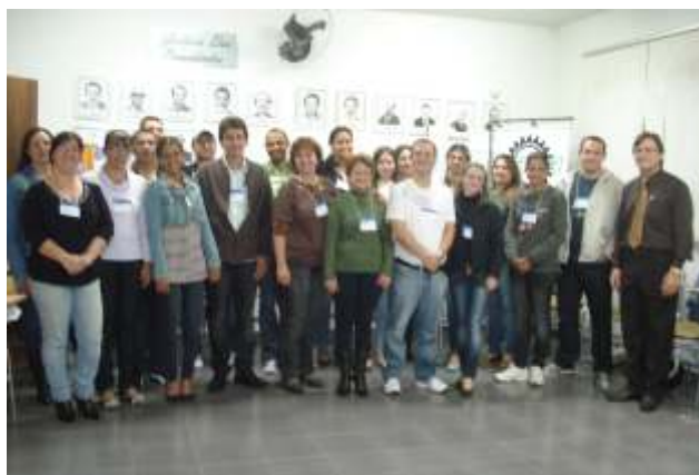
TURMA DO TREINAMENTO "COMO COBRAR E RECEBER DÍVIDAS"