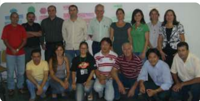
Oficina de Planejamento estratégico dia 09/05/2011

Convidamos toda comunidade interessada em participar do Conselho de Segurança; as reuniões acontecem uma vez por mês nas dependências da ACINE.