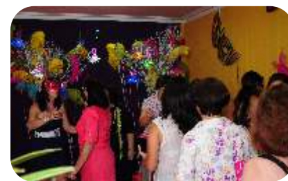
Recepção do jantar