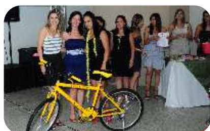
Ganhadora da Bicicleta Prever