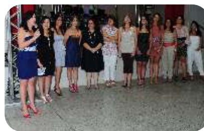
Conselho ACINE Mulher