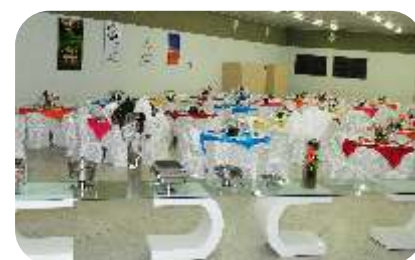
Decoração e Buffet Lelarys