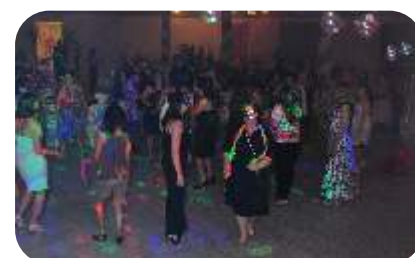
Animação total em um ambiente só para mulheres