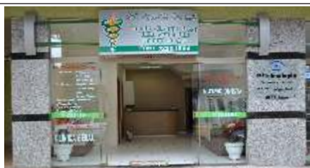
CLÍNICA DR. ELAINE M. FUMAGALLI

Através da visão empreendedora de alguns médicos, Nova Esperança dá início a formação de um centro médico com especialista de várias áreas. Desta forma o polo regional se fortalece e atendemos com qualidade toda população.