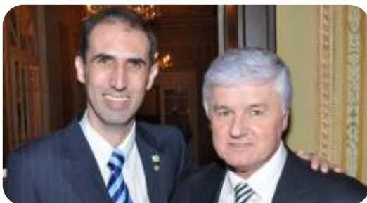
Deputado Valdir Rossoni - Presidente da Assembleia Legislativa do Paraná