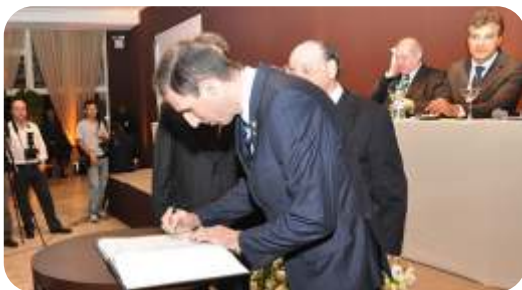
Assinatura do Termo de Posse