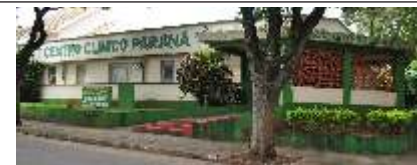
CENTRO CLÍNICO PARANÁ.

Rua Governador Bento Munhoz da Rocha Neto, 947 - Centro - Fone: 3252-0101 ou 3252-4847