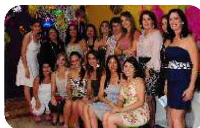
Equipe organizadora do jantar