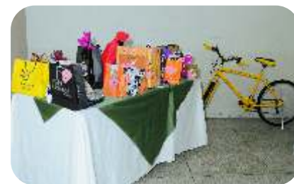
Sorteio de Brindes