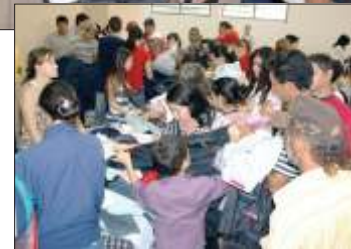
Gracias ao sucesso das Feiras anteriores, o público que esperava a abertura da Feira com expectativa pode comprar mercadorias de qualidade com descontos que chegaram até 60%