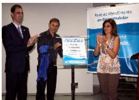
Placa inaugural do P.A. SEBRAE que marca o início das atividades para Nova Esperança e região.