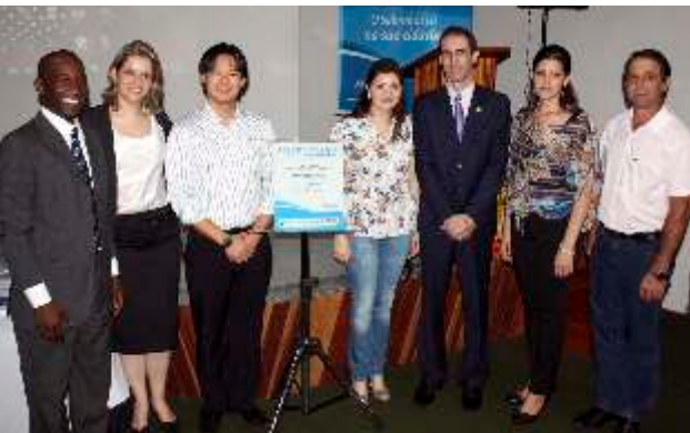
Autoridades presentes na inauguração do ponto de atendimento para empreendedores do Sebrae-PR. Atualmente, dos 116 municípios do noroeste do Paraná, cinco têm Ponto Atendimento, incluindo Nova Esperança.

Cerimônia aconteceu na noite de segunda-feira, 21, no anfiteatro da ACINE; objetivo é oferecer mais atendimentos e soluções para a comunidade empresarial do município